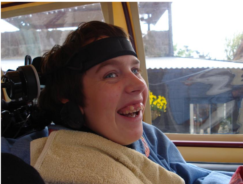
Huifkar rijden is leuk!