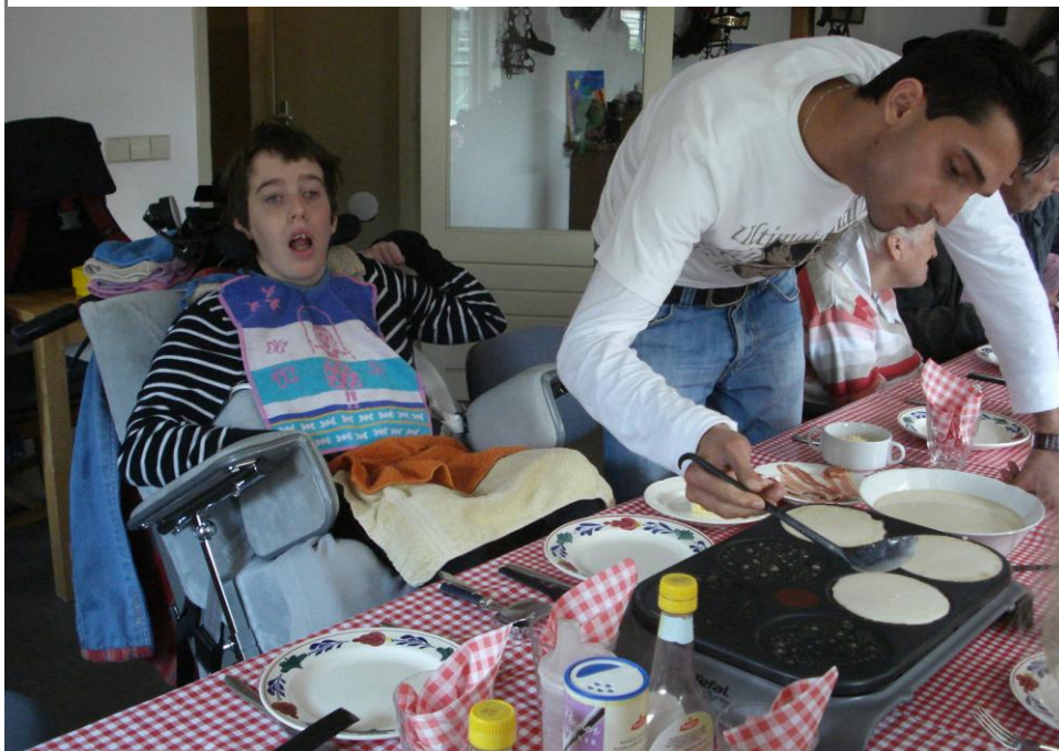
Fanar aan het koken