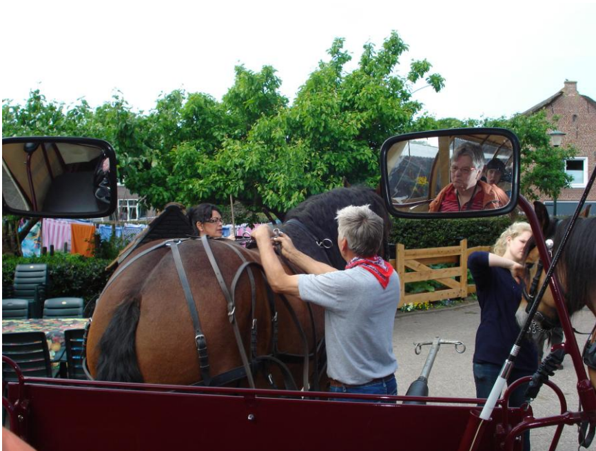
Dit is wat ik ongeveer zag...